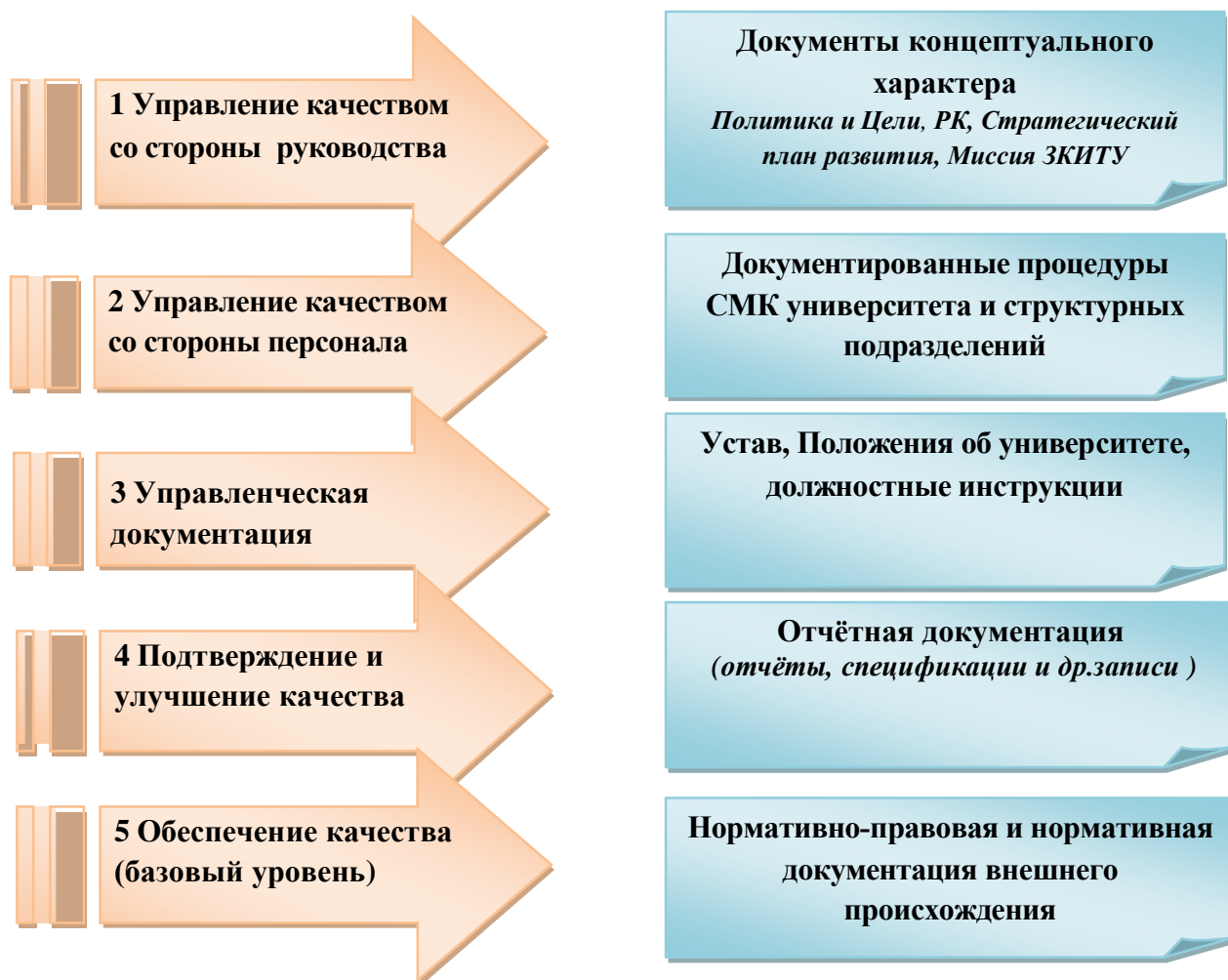
Рисунок 1 - Структура документации СМК ЗКИТУ

Структура документации СМК разработана по иерархическому принципу и состоит из 5 уровней (рис. 1).